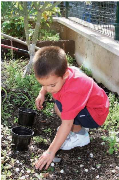
Fig. 2.3. Niño jugando con materiales de la naturaleza.