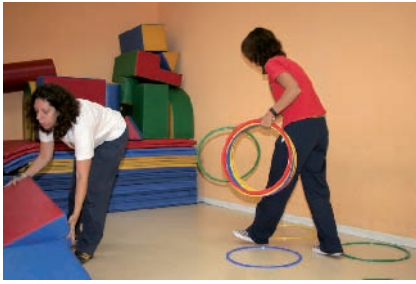
Fig. 2.5. Equipo educativo en plena sesión de trabajo.