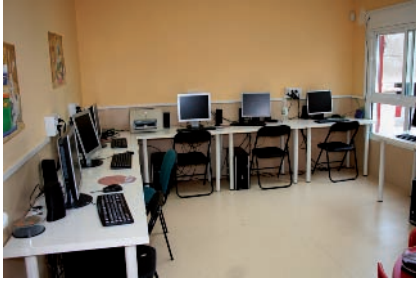
Fig. 2.6. Aula de ordenadores de una escuela de Educación Infantil.