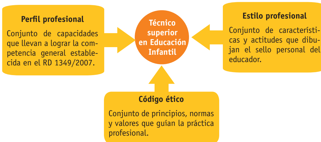
Fig. 2.4. Esquema de la figura del técnico superior en educación infantil.